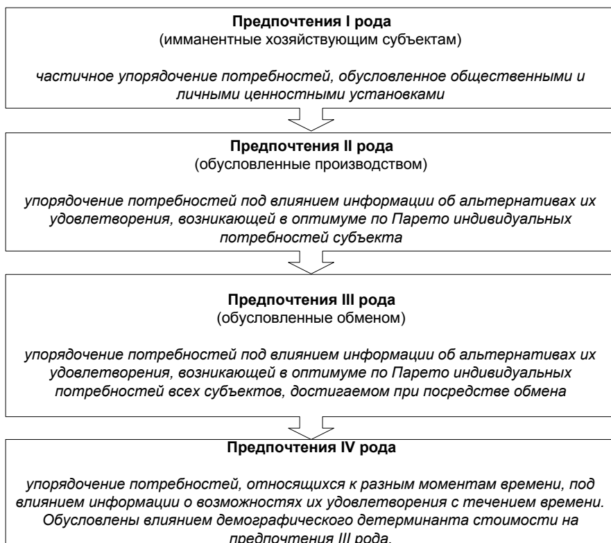
Рис. 1. Виды предпочтений хозяйствующих субъектов

♦ если текущее состояние неоптимально, то существует взаимовыгодный обмен, непосредственно переводящий моделируемую систему в некоторый оптимум.